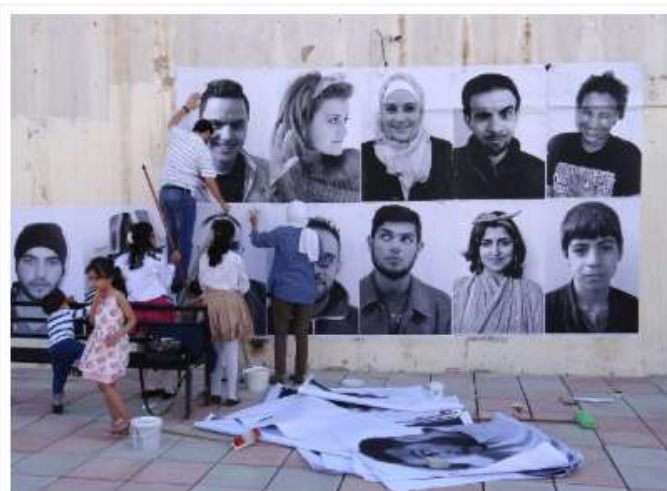
« We are Arabs, We are humans » Jordanie, 2015

Il emploie une quinzaine de personnes et partage son temps de travail entre un studio à Paris et un autre à New York. Il est très actif sur les réseaux sociaux, notamment Facebook et Instagram