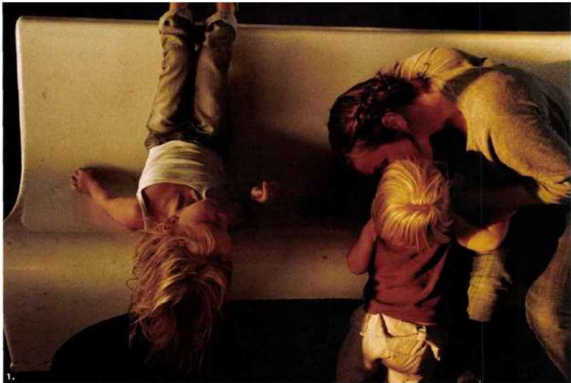
1. Un concours photo est lancé sur mp2018.com pour glaner les clichés les plus tendres. 2, 5 7. Exposition « Roman-Photo » au Mucem. Qualcosa che si chiama amore , Bolero film, 1960. Couverture du magazine Nous Deux , 1971. Raymond Cauchetier, cinéroman À bout de souffle , Le Parisien Libéré , 1969, d'après le film de Godard. 3. Invité de marque, l'artiste JR. 4. L'amour, quel cirque ! Abasedotodesaba , Collectif Na Esquina. 6. Illustration de Stephan Muntaner.